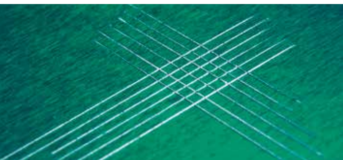
Substrato de Alumínio com primer formulado com o Dynasylan® HYDROSIL 2909

Primeiramente, como um aditivo para tinta e segundo, usado como um primer de pré-tratamento do substrato. Como as tintas são geralmente sistemas com vários componentes, usar o silano como aditivo com frequência apresenta falhas devidos as reações colaterais entre o silano e os componentes da tinta. Nestes casos, recomenda-se o pré-tratamento do substrato com um primer a base de silanos.