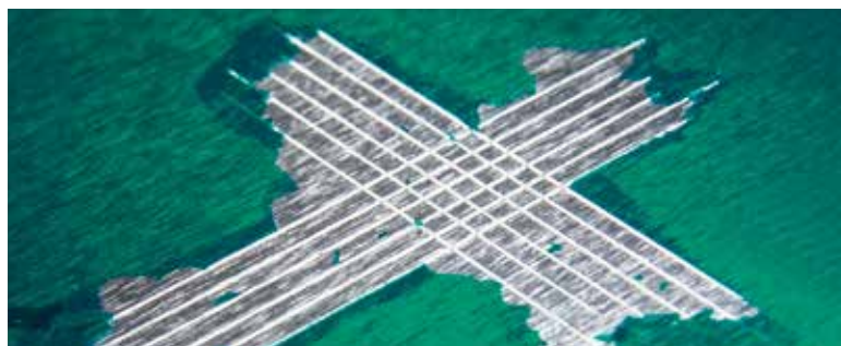
Tinta aplicada sem o pré-tratamento de silano

Novas investigações, resumidas na tabela abaixo, indicam que a quantidade e identidade dos componentes são de extrema importância para alcançar boas propriedades de umectação do substrato. A umectação também é influenciada pelas características do substrato. A superfície deve estar limpa, livre de graxas e poeira. Para alguns substratos, um procedimento de limpeza com solventes orgânicos pode ser suficiente, para outros, uma limpeza com produtos alcalinos ou ácidos à temperatura elevada pode ser necessário. Em alguns casos, a limpeza alcalina pode também ativar a superfície do substrato melhorando o desempenho de adesão, como por exemplo, em substratos metálicos.